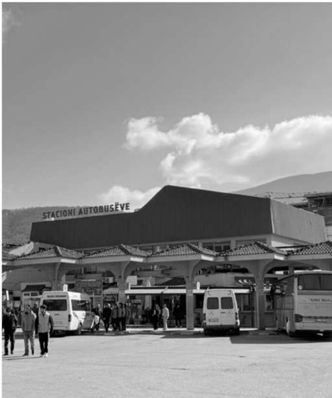
Emri: Stacioni i Autobusëve – Prizren Viti i ndërtimit: Vitet 1970 Vendndodhja: Pjesa lindore e Prizrenit, pranë hyrjes kryesore të qytetit