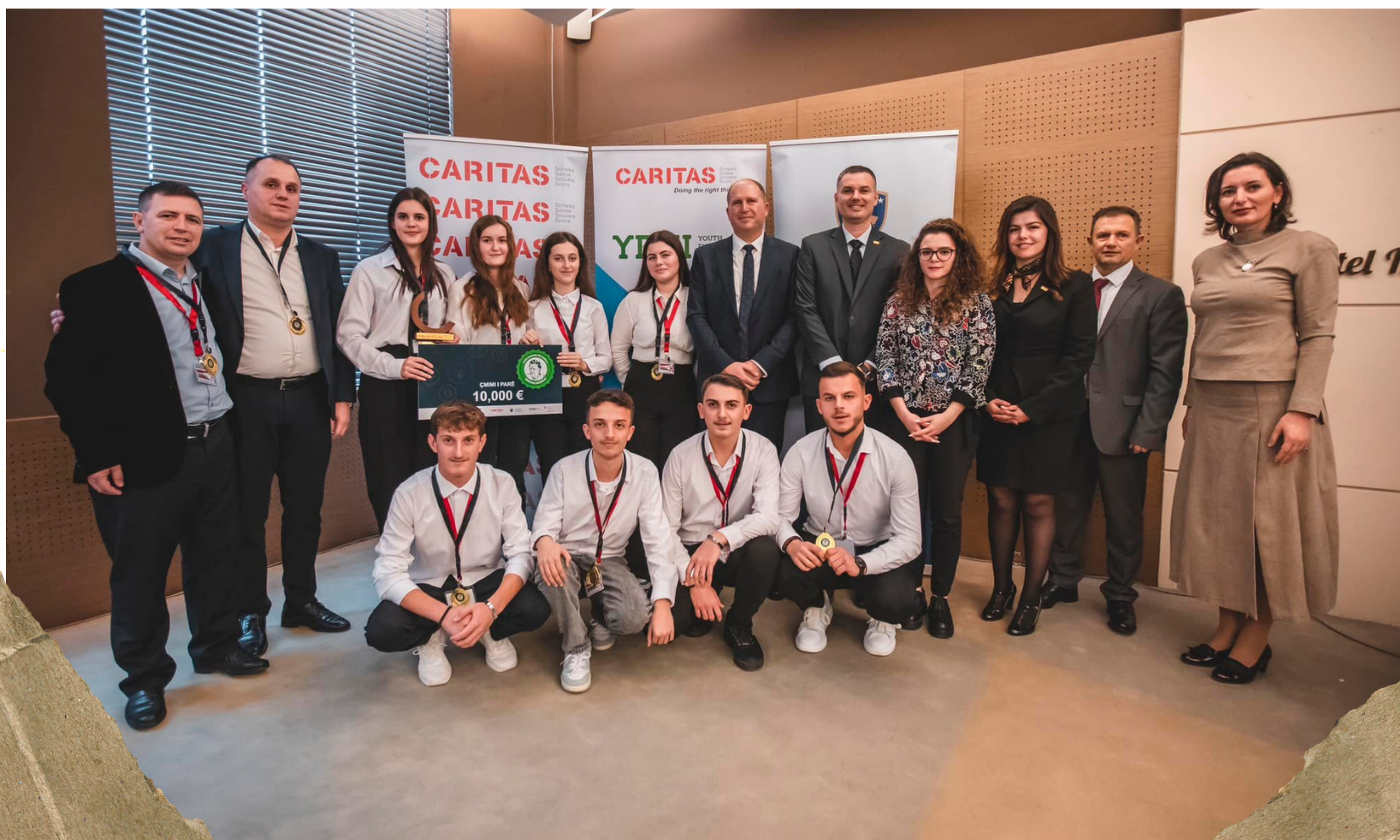
EKO KLUBI "KUJTIM KRASNIQI"