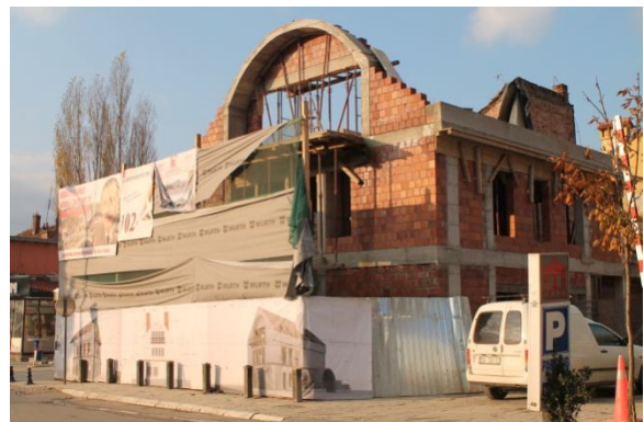
Ish-Jugobanka gjatë “renovimit” në proces e sipër