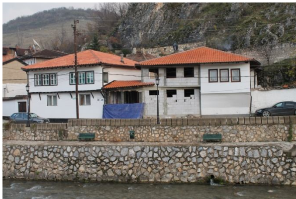
Shtëpia e familjes Bajmaku

Nga ana tjetër, fenomeni apo trendi i ri i "ndërtimit", intervenimit emergjent nën maskën e restaurimit dhe konzervimit të shtëpive tradicionale urbane përmes një projekti të thjeshtë dhe financiarisht modest të komunës, ai i "lyerjes së fasadave", si një akt i përkohshëm i performancës arkitektonike sipërfaqësore e tipit buzëkuq (sa vet kohëzgjatja e saj) është në gjendje ta zgjidh problemin e vërtetë QELIZËN E QYTETIT!