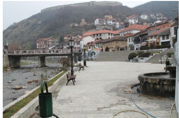
Hapësira publike e Kej-it, në sfond ura e Arastës dhe Kalaja e Prizrenit

thikë. Në krahun e majtë të urës së Arastës 7 kemi një vazhdimësi organike sociale që rrjedh nga kafenetë sipër, ndërsa në krahun e djathtë të urës, poshtë xhamisë së Sinan Pashës ajo shtrihet kaq ftohtë ndaj kontekstit urban dhe vazhdon të shkaktojë një ndikim të fortë në tjetërsimin e hapësirës publike.