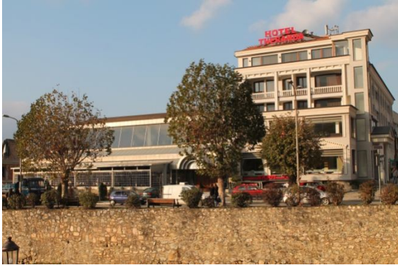
Hotel Theranda – Ish Kompleksi i Arastës