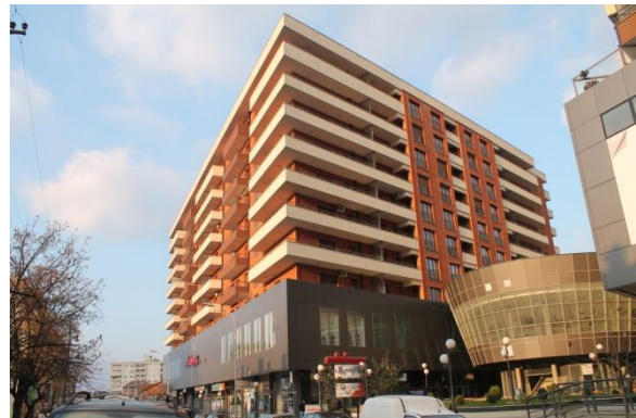
Ndërtimet e reja përballë stacionit të autobusëve