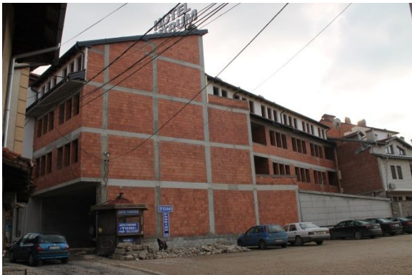
Hotelet në qendrën historike të qytetit