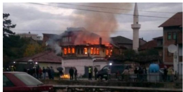
Shtëpia e vjetër e familjes Shehu në Tabakhane