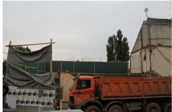
Ish-Jugobanka gjatë shkatërrimit 2013

Michael Moorcock në vitin 1963 e ka quajtur “urbicid” 5 - “dhunë në trupin urban”, për ta krahasuar me termin gjenocid. Sot, edhe pse me vonesë, e kuptojmë se edhe ky operacion nuk ka bërë asgjë tjetër veç se ka kontribuar në zhdukjen e memorieve, ka tronditur lidhjen e njeriut me qytetin dhe mirëqenien shpirtërore të një vendbanimi.