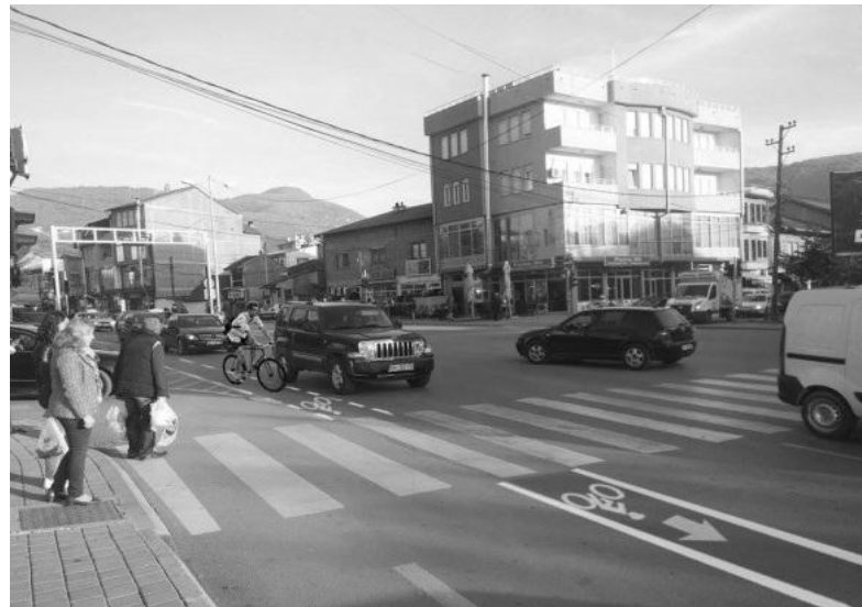
Fig.12. Shtegu në rrugën 'Zahir Pajaziti'