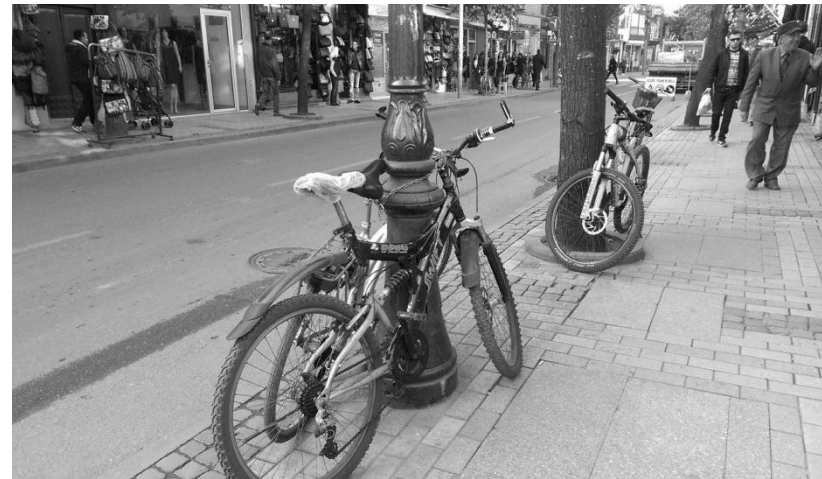
Fig.4. Biçikletë e parkuar në rrugën 'Adem Jashari'