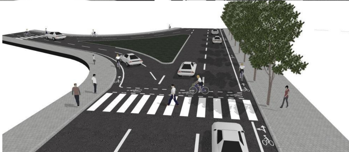
Fig.8. Shtigjet dhe shenjzimet në tri raste (te rrethi në Bazhdarhane(1,3), te trekëndëshi në Bazhdarhane(2))