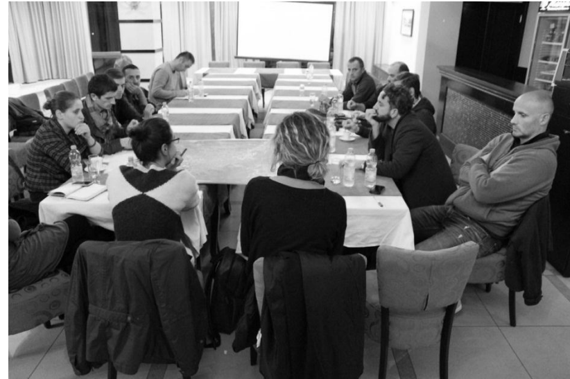
Fig.3. Takimi me çiklistë