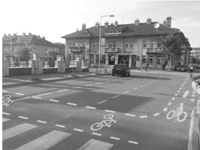
Fig.11. Shtegu pranë zebrave në rrugën 'Brahim Osmanaj'

Iniciativa: 'Përfshirja e komunitetit në procesin e vizionimit të shtegut të çiklistëve në qendër të qytetit të Prizrenit' është vetëm një hap drejt këtij ndryshimi në qytet, por ndryshimet e mëdha bëhen gjithnjë prej iniciativave të vogla e në këtë rast kur iniciativa vjen drejtpërdrejt prej komunitetit të çiklistëve ka vlerë shumë më të madhe!