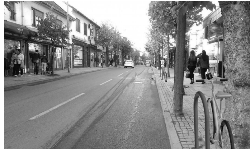
Fig.10. Parking i fiksuar pranë lisave dhe shtyllave elektrike në rrugën 'Adem Jashari'