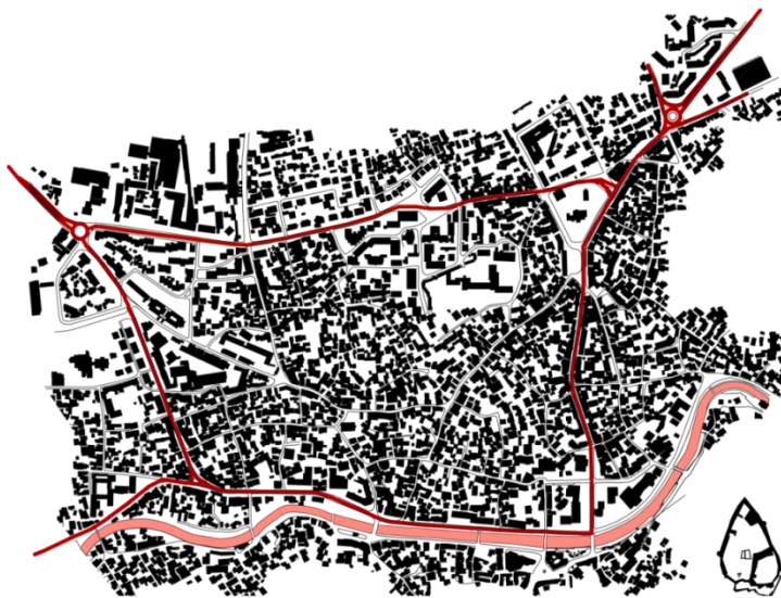
Fig.5. Shtegu i propozuar i çiklistëve

Së pari është përshkruar e gjithë ruga e shenjuar me të kuqe me ç'rast janë mbajtur shënime për të gjitha pengesat eventuale si dhe është kërkuar zgjidhje për secilin ndërrim të llojit të rrugës. Gjithësej kemi evidentuar 7 (shtatë) tipe të rrugëve dhe për secilën është dhënë një zgjidhje/propozim. Gjithashtu është menduar për vendparkingjet e mundshme gjithmonë duke