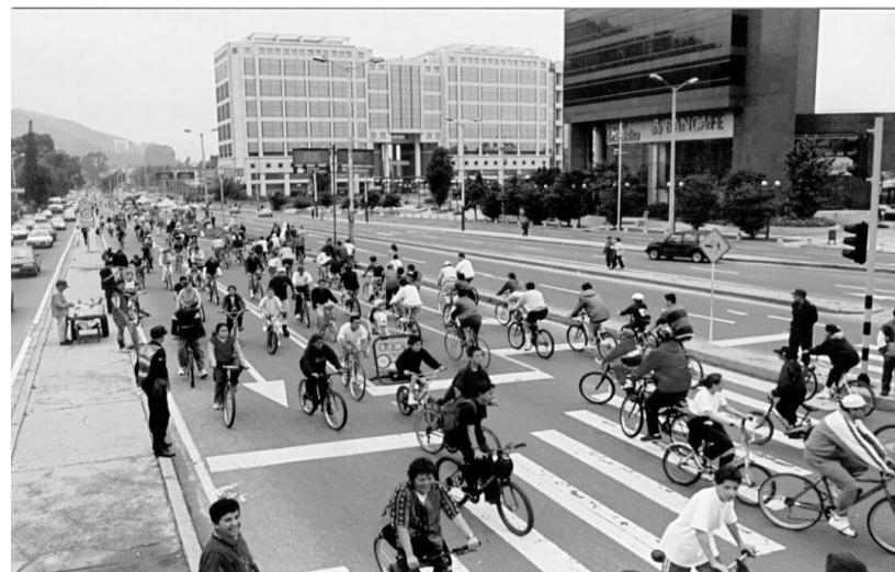
Fig.1. Një rrugë në Bogota

Çiklizmi është qendra e politikës së ndryshimeve klimatike. Çiklizmi në botë ka filluar të bëhet gjithnjë e më shumë çështje për tu zgjidhur. Disa prej ngjarjeve nëpër botë që kanë të bëjnë me çiklizmin janë: Ura e biçikletave në Kopenhagen që si projekt është i guximshëm dhe ka ofruar zgjidhje e cila nuk pengon makinat;