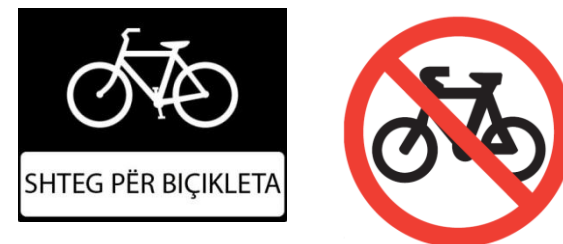
Fig.7. Shenjëzimi vertikal

Më poshtë janë dhënë disa prej sinjalizuesve vertikalë të cilat është menduar të vendosen përgjatë shtegut.