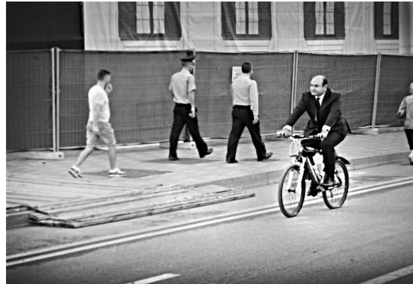
Fig.2. Ministri I transportit duke shkuar në punë me biçikletë

këmbësorët dhe çiklistët Një iniciativë pioniere e cila ka fituar popullaritet nga viti në vit, për të arritur tashmë në gjysmë milioni njerëz të cilët e përdorin atë rregullisht; Anglia mat performancën e Ministrave të saj me përdorimin e transportit publik dhe biçikletës! Kabineti i Kryeministrit Kamerun ka vendosur të gjykojë performancën e ministrave të tij dhe në sajë të përdorimit të transportit publik dhe lëvizjes alternative me bicikleta!; Në Kil ,vajtja në punë me biçikletë mund të kurseje deri ne 3.000 $ në vit! Ministria e Mjedisit të Kilit (MMA) publikoi dje rezultatet e studimit të parë kombëtar mbi mjedisin dhe përdorimin e biçikletave. Në mesin e të dhënave të tjera, një fakt del në pah: vajtja në punë me biçikletë mund të kurseje deri ne 3.000 $ në vit. 1