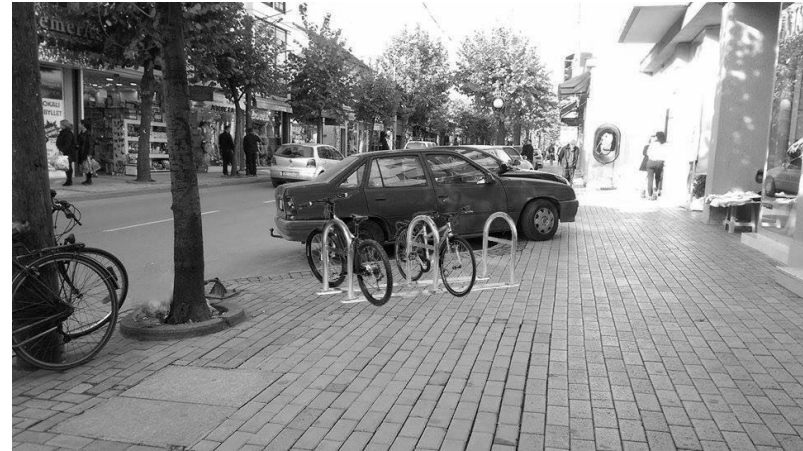
Fig.9. Parking standard i biçikletave në rrugën 'Adem Jashari'

Meqë është vërejtur gjatë analizave që përgjatë rrugës Adem Jashari (nga Hamami i Gazi Mehmet Pashës e deri te Shtëpia e bardhë) kemi raste të shumta kur qytetarët kanë parkuar biçikletat pranë shtyllave ndriçimit publik ose në drunjtë përgjatë rrugës, atëherë është vendosur të bëhet një zgjidhje praktike me një pranë çdo të dru apo shtyllë në të dy anët e rrugës me një gyp \varnothing = 50 , me dimensione : b=60\text{ cm} me l=80\text{ cm} në të cilin gyp mund të lidhen dy biçikleta.