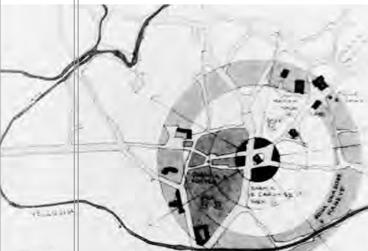
Ilustrim 1. Paraqitja skematike e çarshisë së Prishtinës "Arkitektura tradicionale-popullore e Kosovës", Dr.Sc. Flamur Doli