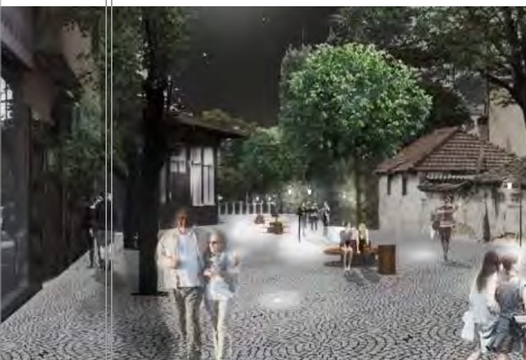
Për revitalizimin e Qendrës Historike të Prishtinës nga udhëheqja e kaluar u prezentua projekti mbi intervenimin në të, me theks në rimateriaizimin e rrugëve dhe kthimin e motiveve të dikurshme.