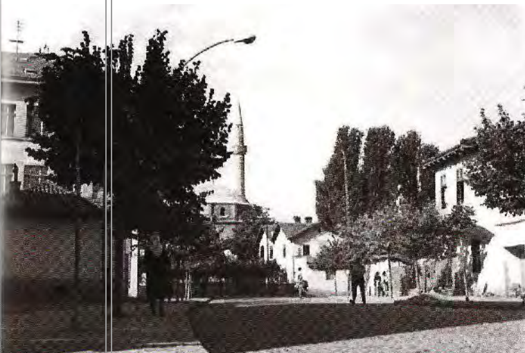
Kjo ishte qendra e dikurshme e Prishtinës, e karakterizuar me përqëndrimin e përmbajtjeve publike të cilat rrethoheshin me objektet e banimit. Dominonin kupollat dhe vertikalet e objekteve të religjionit, minaretet.