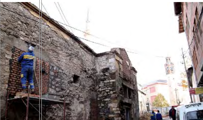
Intervenimet në Hamamit të Madh kanë dërguar deri në shkatërrimin e vlerave të gjendjes burimore të tij.