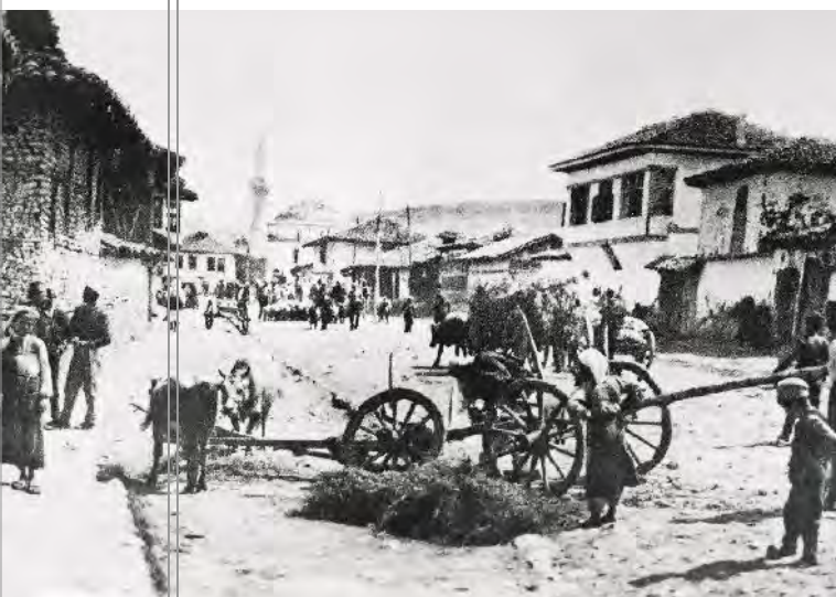
Berthama e Prishtinës ishte e veshur me petkun e mahallave, objekteve të kultit, krojeve, kullave, shtëpive me doksate e të gjitha elementeve të tjera të arkitekturës orientale.

kompozicionale mund të luhasë ndjeshmërinë që banorët e dikurshëm e kishin ndaj hapësirës. "Përvoja hapësinore e mirëfilltë e arkitekturës zgjatet në qytet, në rrugë dhe në sheshe, në rrugica dhe në parqe, në stadione dhe në kopshte, kudo ku vepra e njeriut ka kufizuar disa 'boshllëqe' pra ku ka krijuar hapësira të mbyllura". 14