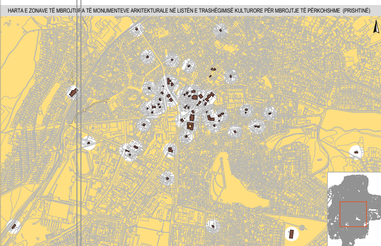
EC Ma Ndryshe punoi një hartë, në të cilën paraqiten të gjitha ndërtimet që janë në listën e trashëgimisë kulturore për mbrojtje të përkohshme si dhe perimetri prej 50 metrash që përbën zonat e mbrojtura rreth atyre ndërtimeve

janë në listën e trashëgimisë kulturore për mbrojtje të përkohshme në qytetin e Prishtinës, si dhe perimetri prej 50 metrash që përbën zonat e mbrojtura rreth atyre ndërtimeve". 42