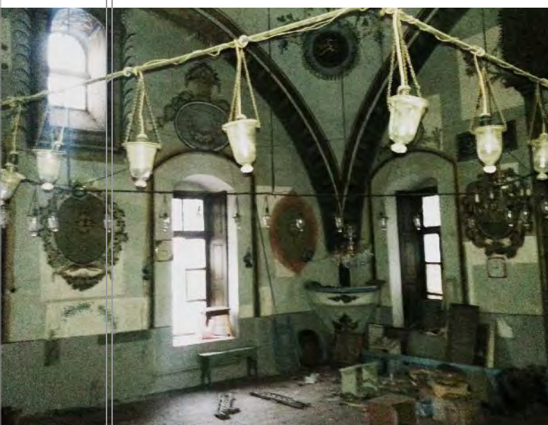
Në Xhaminë e "Jashar Pashës", për shkak të zhagjës së punëve restauruese, gjendja e enterierit përveq nostalgjisë për vlerat e dikurshme të saja, të sjell keqardhje.