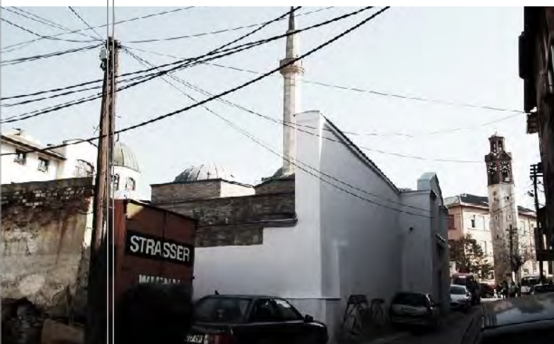
Humbja e elementeve burimore, aplikimi i materialeve bashkëkohore e në masë të madhe betonimi i strukturave të këtij monumenti, ka dërguar deri në tjetërsimin enorm të asaj që dikur njihet si Hamami i Madh i Prishtinës