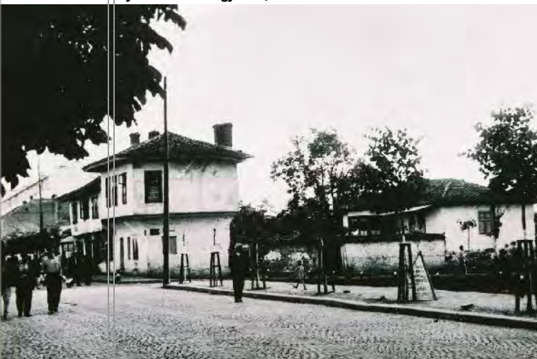
Struktura e dikurshme e qytetit oriental ishte e konceptuar ne rrugët e ngushta të cilat gruponin shtëpitë individuale duke formuar kompozicione 'mahallash'.