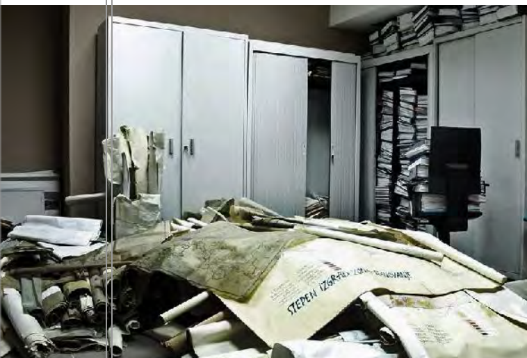
Planet urbanistike dhe dokumentacioni përcjellës i pasistemuar pasqyrojnë jo seriozitetin e trashëguar në Komunën e Prishtinës lidhur me trajtimin e problematikës së Qendrës Historike dhe më gjerë.