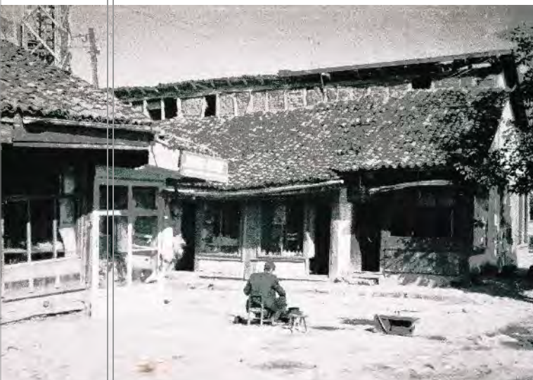
Rëndësia e Qendrës Historike qëndronte në çarshinë e qytetit që shtrihej mu në pjesën qendrore të saj.